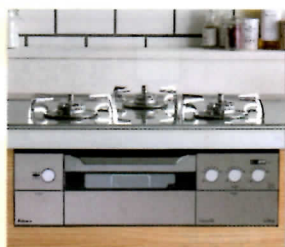
Siセンサーコンロ (ビルトインコンロ)