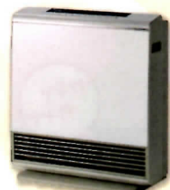
ガスファンヒーター