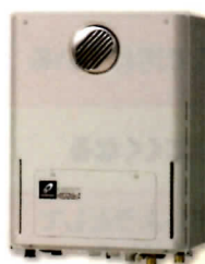
エコジョーズ (LPガス高効率給湯器)